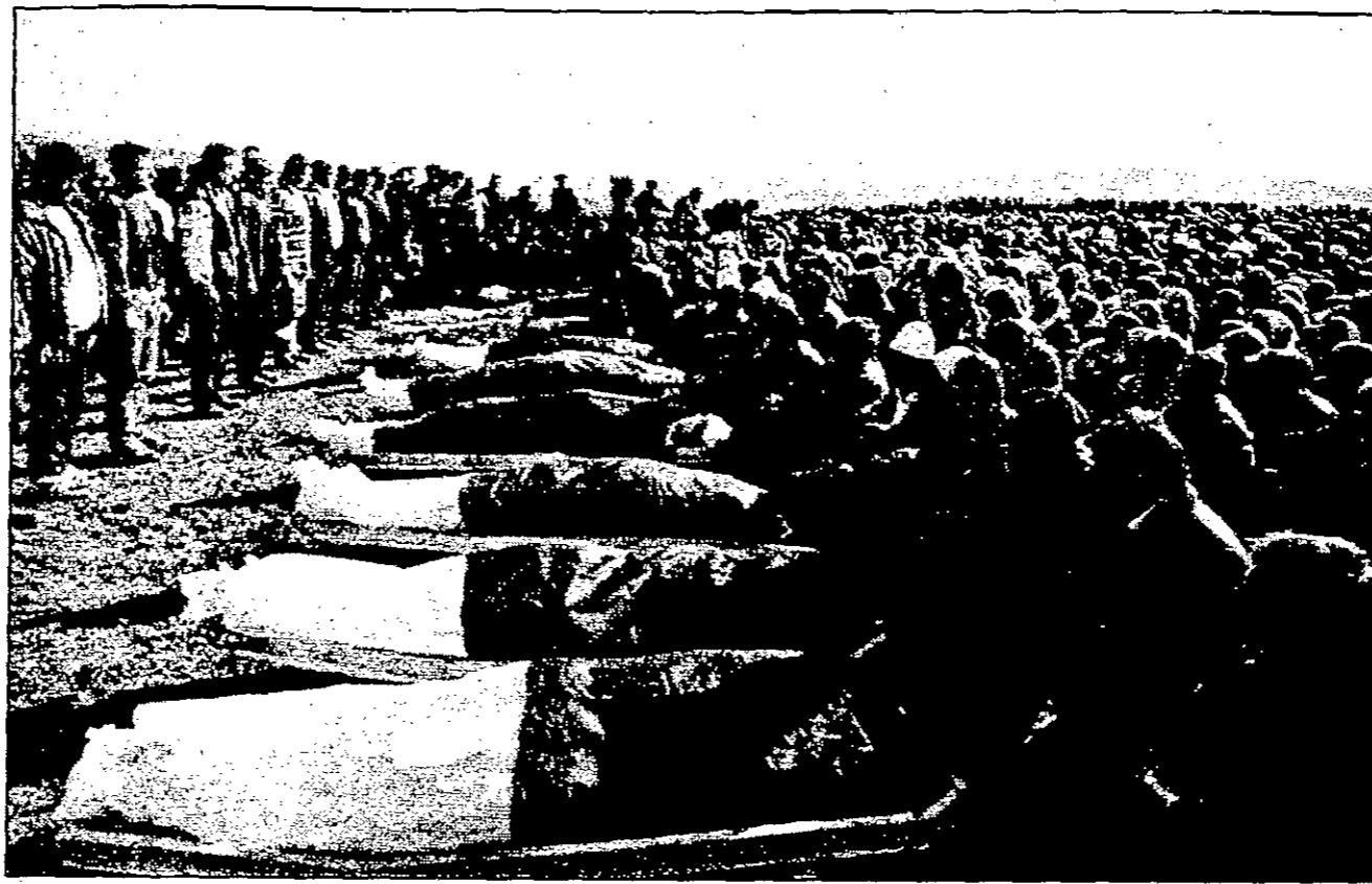
جموعه كبيره من البان كوسوفو يشكروا في جنازة جماعية لثلاثين شهيداً لاقوا حتفهم الثلاثاء برصاص الشرطة الصربية